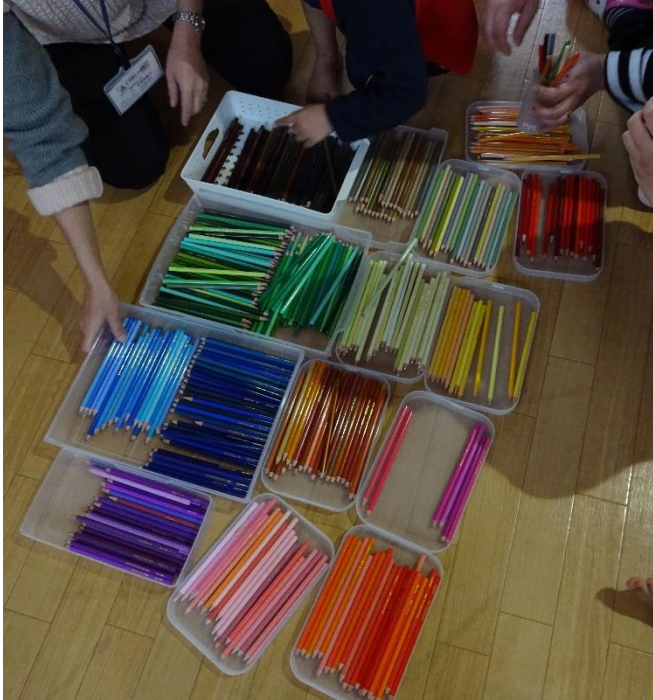
色鉛筆、同じ色に見えても全部同じ色なんですよ！