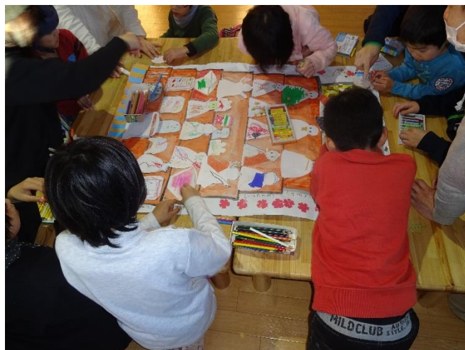
どんなひな壇が出来るかとても楽しみです！