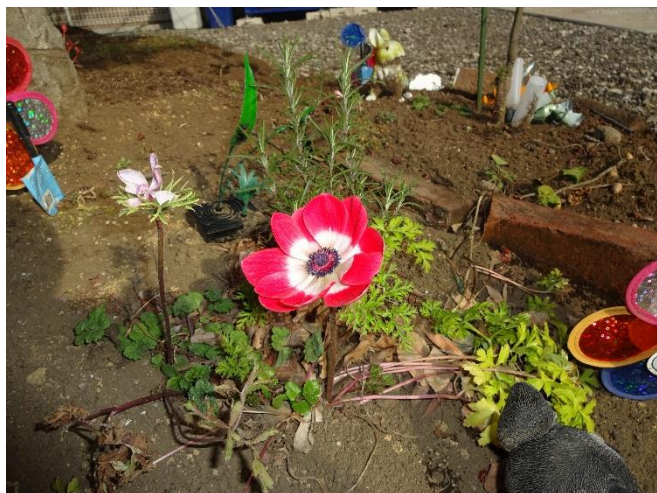
真っ赤なアネモネが咲きました！

そして、3月と言えばひな祭り！2月の工作から3月3日のひな祭りに向けて、準備を進めています。出来上がった作品は玄関に飾りますので、是非一度ご覧になって下さい！