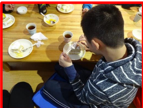
ケーキ美味しくできました！

臨床美術では自由工作や塗り絵をしました♪ 1人1人、自分らしい作品を作っていました！色づかいが子どもによって様々で、 出来上がった作品を見ていて楽しかったです♪