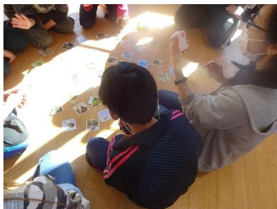
かるた、みんな真剣でした！