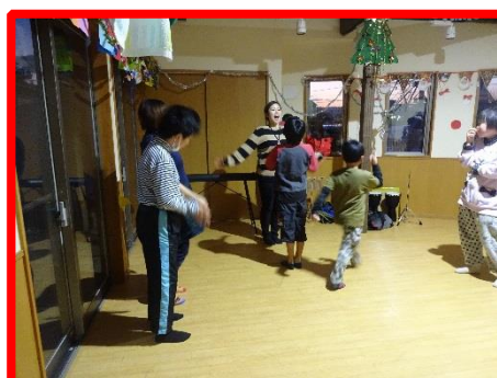
元気に取り組んでいます！