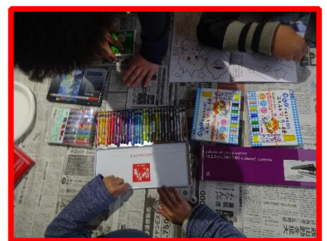
個性豊かな色使い！