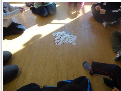
ばばぬきも楽しかったですね！