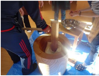
これがおもちになるのかな？