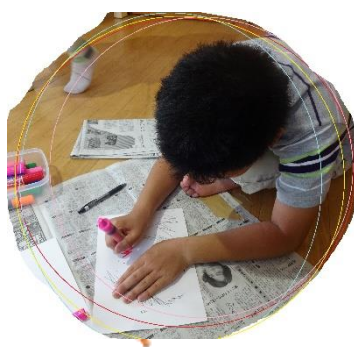
○すごく集中していました。