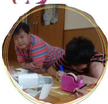
○一生懸命、作品を作っています。