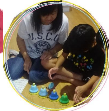
○音楽療法も楽しそうでした！