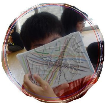
○紐を使った美術の作品