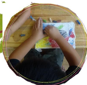
○カラフルで綺麗です！！